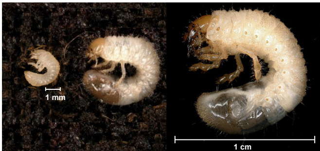
Abb. 3: v.l.n.r. Larven der drei Stadien von P. japonica (Foto: Giseler Grabenweger, Agroscope).

Die Larven gehören zu den Engerlingen und durchlaufen drei Stadien (Abb. 3). Sie können durch die Grösse nur ungefähr von anderen Engerlingen unterschieden werden. Eine eindeutige Identifikation ist durch V-förmig angeordnete Borsten auf dem hintersten Abdominalsegment möglich. Die Puppe gleicht von der Form her dem adulten Tier und ihre Farbe verdunkelt sich während der Metamorphose.