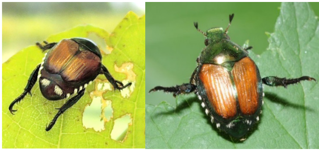
Abb. 2: Adulte Japankäfer, links: gut sichtbar die weissen Haarbüschel, rechts: typisches Alarmverhalten (Foto: Cristina Marazzi, SFito TI und Christian Schweizer, Agroscope).

Die Larven gehören zu den Engerlingen und durchlaufen drei Stadien (Abb. 3). Sie können durch die Grösse nur ungefähr von anderen Engerlingen unterschieden werden. Eine eindeutige Identifikation ist durch V-förmig angeordnete Borsten auf dem hintersten Abdominalsegment möglich. Die Puppe gleicht von der Form her dem adulten Tier und ihre Farbe verdunkelt sich während der Metamorphose.