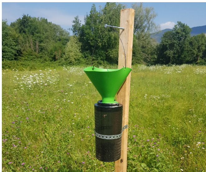
Abb. 6: Trichterfalle zum Fangen von P. japonica im Tessin.

Die Früherkennung ist wichtig für eine effektive Bekämpfung von P. japonica . Insbesondere Tilgungsmassnahmen können nur erfolgreich sein, wenn der Japankäfer entdeckt wird, bevor er sich grossräumig ausbreitet. Deshalb führt der Eidgenössische Pflanzenschutzdienst in Zusammenarbeit mit den Kantonen eine Gebietsüberwachung durch, um neue Ausbrüche möglichst frühzeitig zu entdecken. Die Früherkennung erfolgt insbesondere mittels Fallen, die Pheromone und Kairomone (Sexual- und Frasslockstoffe) enthalten (Abb. 6). Werden Käfer entdeckt, muss dies umgehend dem zuständigen kantonalen Dienst gemeldet werden.