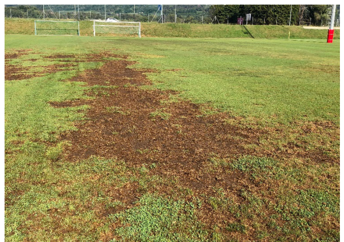
Abb. 5: Schäden auf einem mit P. japonica befallenen Fussballplatz im Tessin.

Die Larven ernähren sich bevorzugt von Graswurzeln (Rasen und Weiden), aber auch andere Kulturpflanzen wie Mais, Soja oder Erdbeeren können betroffen sein. Vor allem Golfplätze, Fussballfelder und andere Rasenflächen werden durch den Frass der Larven beschädigt (Abb. 5). Eine hohe Larvendichte im Boden führt zu braunen, ausgetrockneten Stellen im Rasen. Bei anderen Kulturpflanzen kann es zu einer geringeren Ernte oder zum Absterben der Pflanzen kommen. Die Larven werden gerne von Krähen und Wildschweinen gefressen, was zu Sekundärschäden führen kann.