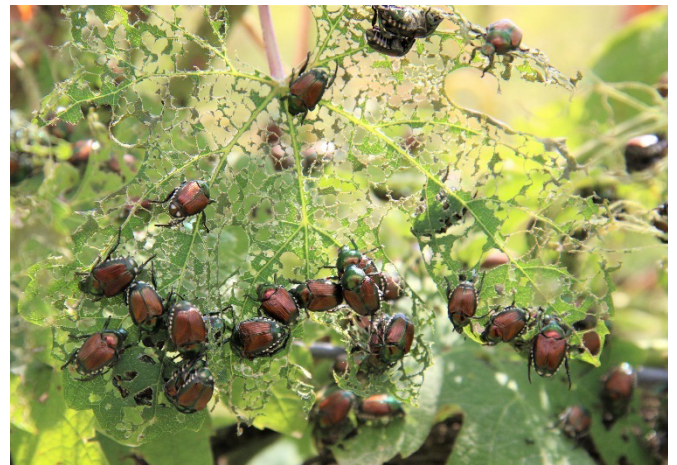
Abb. 1: Japankäfer auf einem Rebblatt, das den typischen Skelettierfrass zeigt.

In der Schweiz entwickelt P. japonica generell eine Generation pro Jahr. In kühleren Regionen kann der Fortpflanzungszyklus zwei Jahre dauern. Im Mai und Juni beginnen die adulten Käfer zu erscheinen und sich zu paaren. Die Flugzeit dauert von Mitte Mai bis September mit dem Hauptflug im Juli. Die Käfer sind vor allem bei Temperaturen von 21 bis 35 °C, wenig Wind und einer Luftfeuchtigkeit über 60% aktiv. Während der Lebensdauer von vier bis sechs Wochen legt jedes Weibchen