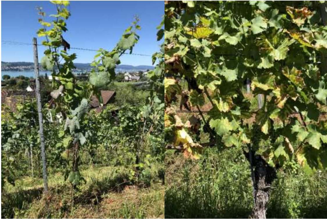
Bild 3: Akute Form der Esca, der Stock verdorrt innert kurzer Zeit.