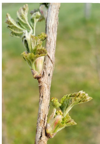
Johannisbeere Jonkheer van Tets am 29.03.22