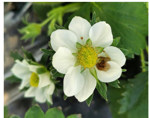
Erdbeerblüten sind auch im Tunnel rechtzeitig vor Pilzbefall zu schützen (thoh)

In frühen Sorten, sowie Remontierenden zum Schieben der Blütenstände und erste offene Blüten eine Fungizid-Behandlung mit Moon Sensation gegen Fruchtfäulen, Mehltau sowie Blattfleckenkrankheiten durchführen. Besonders auf die angesagten Niederschläge hin ist ein Schutz ab Beginn Blüte wichtig. Zur Hauptblüte dann Botrytizmittel, wie z.B. Switch und Frupica SC oder Moon Privilege einsetzen und Wirkstoffwechsel beachten.