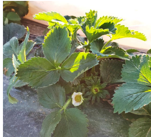
Erdbeere verfrüht mit Doppelvlies 24.03.22 (wysc)

Bei verfrühten Beständen sind erste Blütenanlagen unter den Blättern sichtbar. Die Entwicklung ist ähnlich weit, wie im letzten Jahr (2021). Interessant ist der Vergleich mit Bildern aus dem Jahr 2020 (siehe Bilder hier unten), in welchem die Entwicklung der Pflanzen Ende März schon deutlich weiter war.