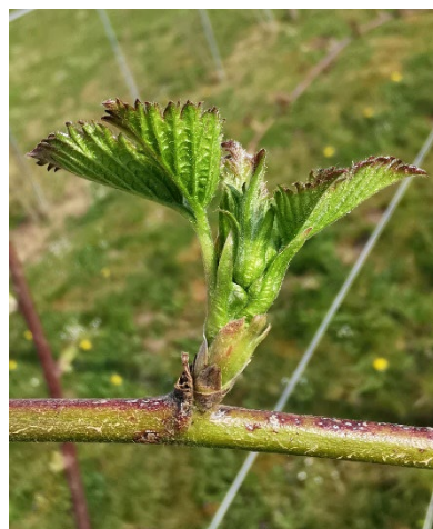
Brombeere Loch Ness im Freiland am 29.03.22 (thoh)