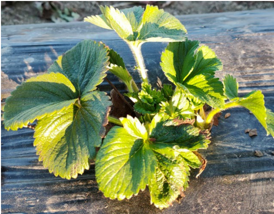
Erdbeere unverfrüht 24.03.22 (wysc)