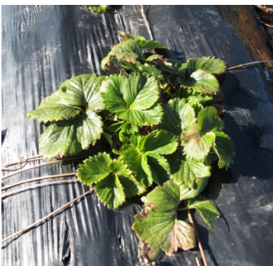
Erdbeere unverfrüht 30.03.20 (wysc)

Bei verfrühten Beständen sind erste Blütenanlagen unter den Blättern sichtbar. Die Entwicklung ist ähnlich weit, wie im letzten Jahr (2021). Interessant ist der Vergleich mit Bildern aus dem Jahr 2020 (siehe Bilder hier unten), in welchem die Entwicklung der Pflanzen Ende März schon deutlich weiter war.