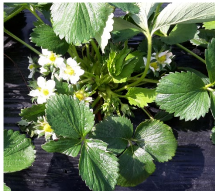
Erdbeere verfrüht 30.03.20 (wysc)