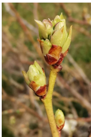
Heidelbergbeere Bluecrop am 29.03.22

Vom ersten bis 10. März dieses Jahres schwankten die Temperaturen noch im winterlichen Bereich von -5 °C bis knapp +9 °C. Dies hielt den Austrieb der Pflanzen zurück. Seit dem 11. März aber erreichen die Temperaturen täglich mehr als +10°C, jetzt gegen Ende des Monats erreichen sie nachmittags sogar knapp 20°C. Bei Strauchbeeren ist der Austrieb ersichtlich. Bei Erdbeeren unter Vlies sind die Blütenanlagen am Rosettenboden sichtbar, vereinzelt ist bereits eine erste offene Blüte vorhanden. Gegen Ende dieser Woche wird es wieder deutlich kühler und regnerisch. Es besteht die Gefahr von Frost und Schneefall auch in tiefen Lagen. Der Stand der Vegetation ist aktuell einige Tage früher als 2021, aber später als 2020.