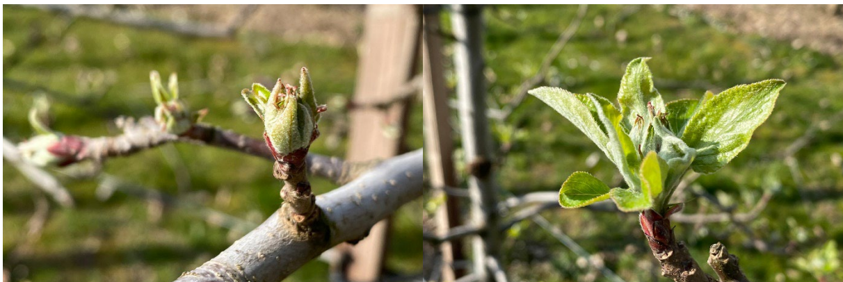
Gala Galaxy in Lindau am 21.03.2022 im Mausrstadium (BBCH54), heute am 28.03.2022 bereits knapp vor dem Grünknospenstadium (BBCH 56) mit gut entwickelten Rosettenblättern.

Mit den vorausgesagten Niederschlägen und der zu erwartenden, lang anhaltenden Blattnassdauer, wird es trotz kühlen Temperaturen ohne protektivem Schutz zu ersten Schorfinfektionen kommen. Der Vegetationsfortschritt in den vergangenen, sonnigen Tagen war enorm, ebenso der Blattzuwachs. Aus diesem Grund wird eine protektive Behandlung mit einem Fungizid vor der nächsten Niederschlagsperiode dringend empfohlen, um die bereits grossen Rosettenblätter optimal zu schützen. Dies gilt auch dann, wenn in der letzten Woche bereits eine Fungizidbehandlung ausgebracht wurde.