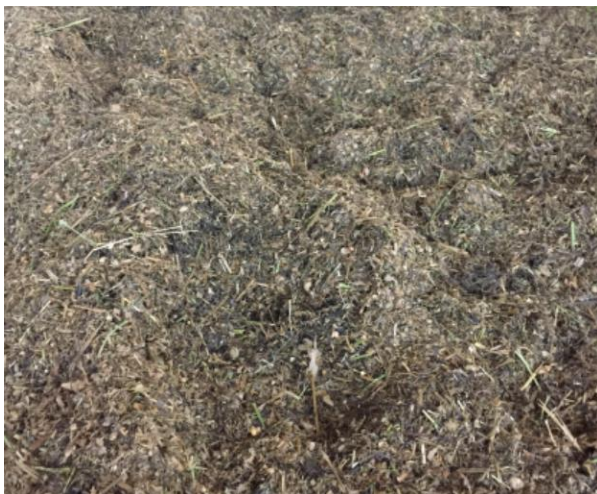
Optimal gemischte Ration mit kurzen Faserpartikeln

Deshalb sollten Kühe gerade nach der Futtervorlage beim Fressen beobachtet werden. Bei einer gut gemischten Ration senken die Kühe den Kopf und fressen aktiv und schnell von oben ab. Wenn die Kühe mit der Nase im Futterhaufen stöbern und den Futterberg auseinanderschieben, ist erhöhte Aufmerksamkeit geboten. Kühe schieben das Futter auseinander, um an den Futtertischboden zu gelangen, wo sie Feianteile, welche durchgerieselt sind, fressen (sogenannter Lochfrass). Dann kann davon ausgegangen werden, dass die Kühe stark selektieren.