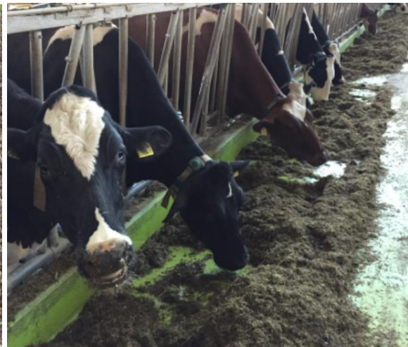
Lochfrass sichtbar, unbedingt Kühe beobachten, ob sie das Futter vor sich herschieben.